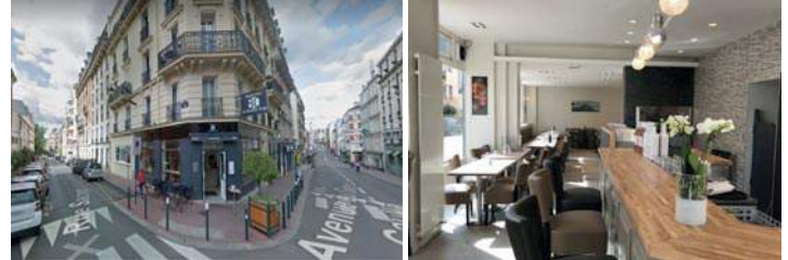
Les Assises de la Pierre Papier

80 avenue du Général de Gaulle 94120 SAINT MANDE